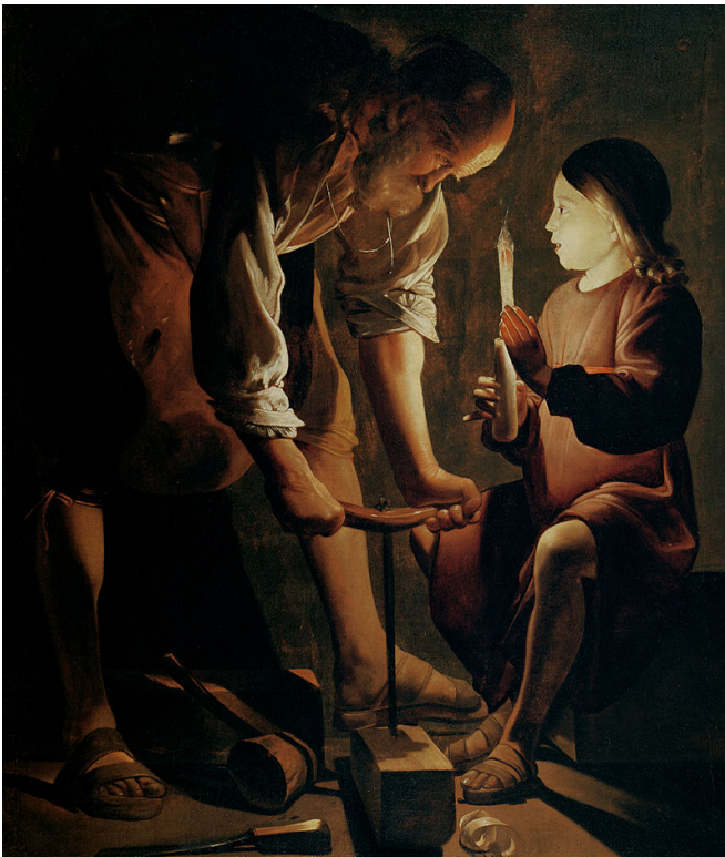
Georges de La Tour, Saint Joseph charpentier, 1645 musée du Louvre.