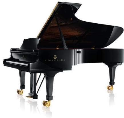
Piano à queue