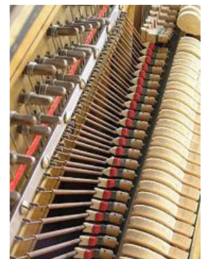
Les marteaux du piano

Lorsque l'on presse une touche, on actionne un marteau , couvert de feutre, qui vient frapper une corde correspondante à une note.